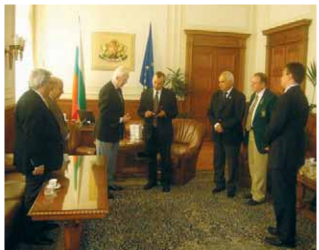
На гости в Народното събрание

Приятели мои, вярвам, че „мирът е възможен“, ако всички ние работим за неговото постигане!