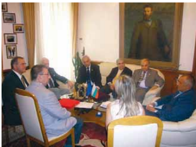
На срещата с кмета на София ген. Бойко Борисов официалните лица от РИ изразиха удивлението си от темпото, с което се развива градът

Темата на моето слово е „Как Ротари може да допринесе за мира чрез служба извън пределите на политиката.“ Според мен политиката е вземане на съвместно решение от отделните лица и групи на базата на техния „личен интерес“, а не на базата на общия интерес. Интересите са на религиозна, културна, икономическа и политическа основа. Несъмнено не-