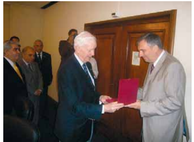
Президентът на Ротари Интернешънъл и официалните гости бяха приети от министъра на външните работи Ивайло Калфин

Един ден ние ще се убедим, че мирът не е само далечна цел, която преследваме, а средство за постигане на тази цел. Трябва да преследваме мирни цели с мирни средства.