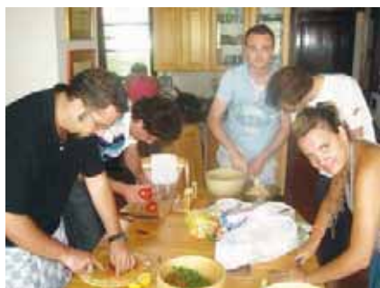
Неуморни и в кухнята...

Една от основните цели на международния лагер беше не само да се запознаем с културата, нравите и обичаите на нашите любезни сръбски домакини, а и те да се докоснат до близки и далечни култури, да се срещнат с приятели от различни кътчета на света. Именно затова един цял ден беше посветен на представяне на всяка нация, участваща в лагера. Основната задача беше всеки от нас да приготви традиционно за страната си ястие, да го "гарнира" с подходяща национална напитка и да позира пред