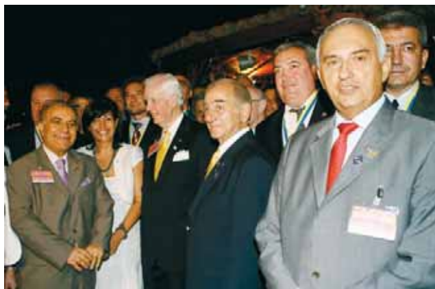
Президентът на Ротари интернешънъл връчи отличия на 74 български ротарианци