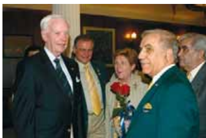
Високите гости бяха посрещнати с български рози