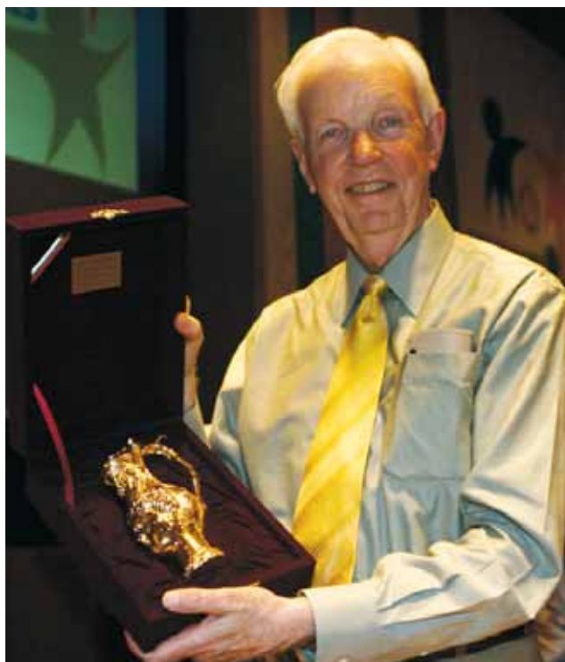
На официалните гости бяха подарени копия на предмети от Панагюрското златно съкровище

... Ротари провежда най-мощната в света стипендиантска неправителствена програма. От стартирането ѝ преди шестдесет години повече от 38 000 студенти имат възможността да пътуват в чужбина и да служат като посланици на добра воля за подобряване на международното разбирателство. Днес съществуват няколко вида такива стипендии. Препоръчвам да отделите особено внимание на нашите стипендии за култура. Те предвиждат три или шест месеца интензивно езиково обучение и запознаване с бита и културата на хората от различни държави. Престоят е в приемно семейство. Не зная дали програмата е провеждана между съседни дистрикти на Балканския полуостров, но си заслужава да се реализира.