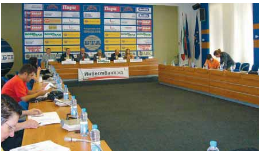
Пресконференцията в БТА

На 29 август организаторите на събитието - РИД Йорсчелик Балкан и ПДГ Акън Гьокай от Турция, председателят на организационния комитет