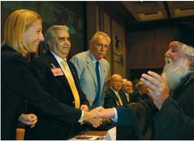
Митрополит Дометиан поздравява официалните гости