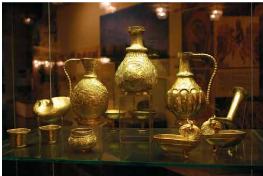
Предмети от Рогозенското златно съкровище в НИМ

На 30 август официалните лектори на конференцията поднесоха вижданията си за приноса на Ротари за мир. Подробности на с. 11.