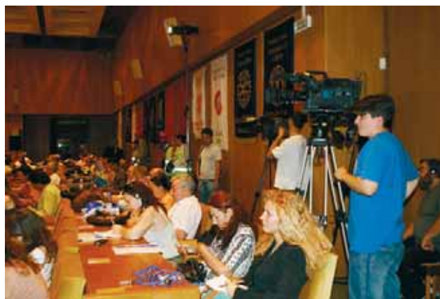
В пленарната зала

Немалко хора се наслаждават на съвременния начин на живот, но повечето на практика живеят в условия, характерни за времето от преди 100, 200 или повече години. С удивително бързия напредък на информационната и комуникационната сфера този контраст ще става все по-голям. Ще възникнат остри и опасни конфликти между образованите и неграмотните хора.