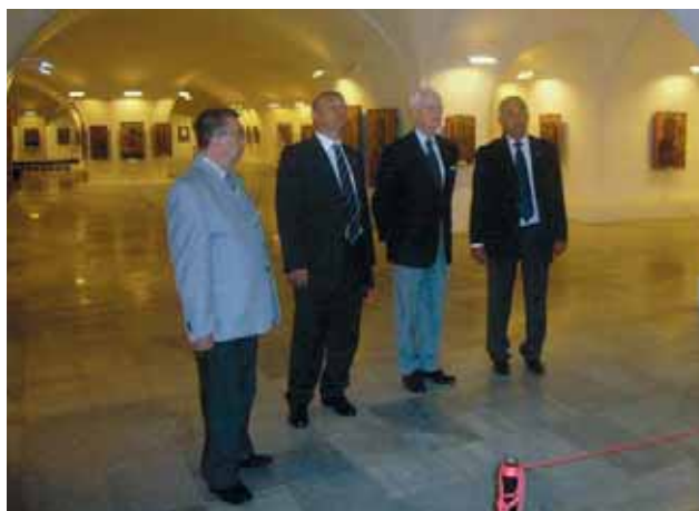
Официалните гости се разходиха по жълтите павета и разгледаха криптата на храм-паметник "Александър Невски"