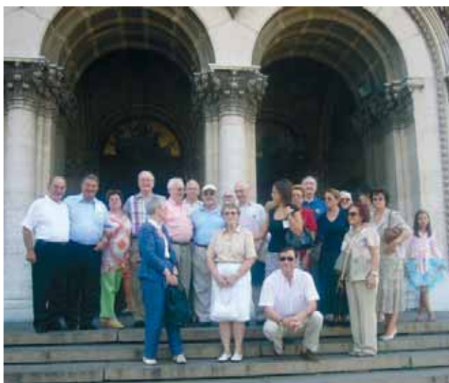
Гостите се възхитиха от великолепната архитектура на храм-паметника "Александър Невски"

то незнание и нашите предразсъдъци... Когато половината човечество не може да чете, няма мир по света. Когато половината човечество е гладно, няма мир по света. Когато има мир в къщата, има мир и в селото. Когато има мир в селото, има мир и в областта. Когато има мир в областта, има мир и в държавата. Когато има мир в държавата, има мир и по света.