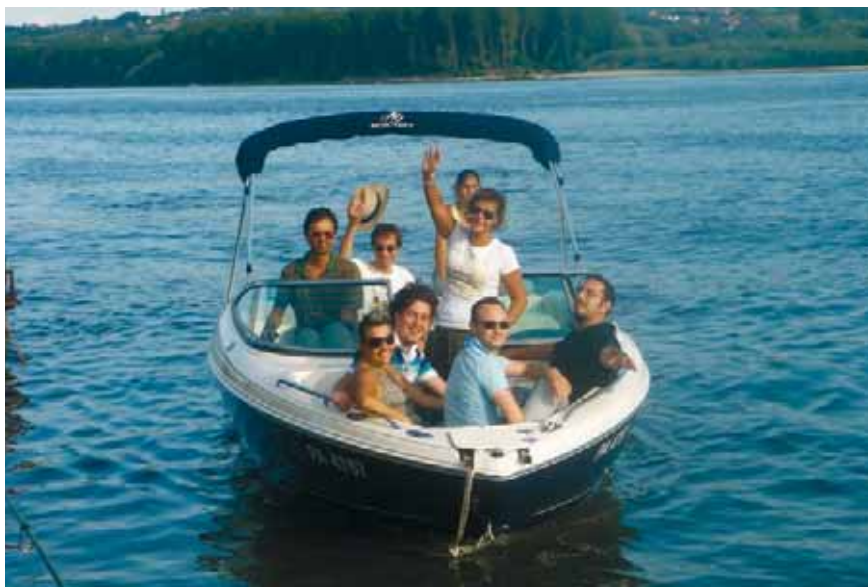
... и по Дунава

медиите, дошли да отразят това събитие на брега на Дунав, където наш домакин беше един от ротарианците от Нови Сад. Дългият следобед завърши с разходка с лодка по Дунав, което беше и един от най-вълнуващите моменти по време на престоя ни там. Денят беше увенчан и от още едно важно събитие: посещение