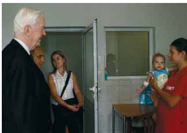
Президентът на Ротари посети Александровска болница. Детската клиника за белодробни заболявания към болницата бе изцяло обновена с помощта на Ротари клубове от България, Германия, Англия, Белгия и Франция

съгласия винаги ще има. Това е тясно свързано с човешката природа.