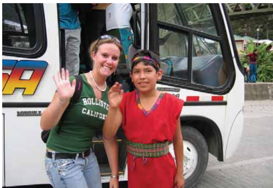
Ванеса е готова да отпътува от Мачу Пикчу

Алис Чен, журналистка на свободна практика от Чикаго